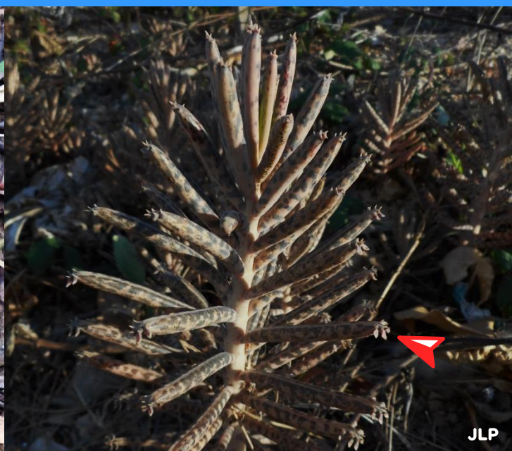
Kalanchoe daigremontiana plec visible a la base de la fulla